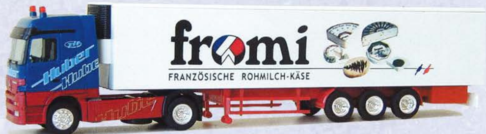
Best.-Nr. 250 069* MB Actros Kühlkoffer "Huber-Spedition" DM 38.-