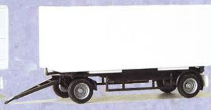
Best.-Nr. 500 191** Solo-Anhänger Wechselkofer DM 8.90