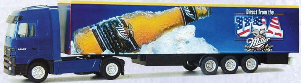
Best.-Nr. 250 099** MB Actros Sattelzug "Miller Bier" DM 45.-