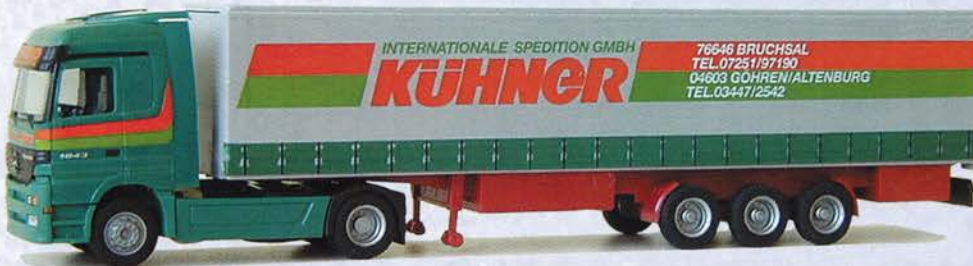
Best.-Nr. 250 096* MB Actros Gardinenplane "Kühner-Spedition" DM 36.-