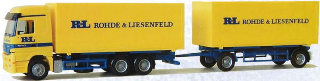
Best.-Nr. 250 095* MB Actros Hängerzug "Rohde & Liesenfeld"