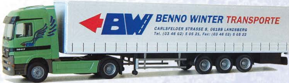
Best.-Nr. 250 094* MB Actros Gardinenplane "Winter-Transporte" DM 36.-