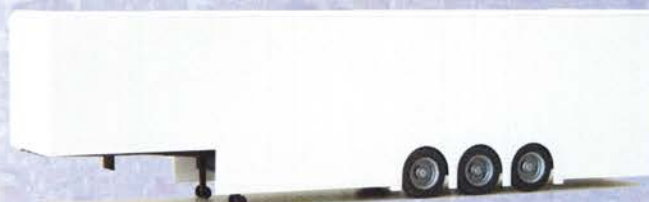
Best.-Nr. 500 187** Solo-Auflieger Doppeldecker DM 10.90