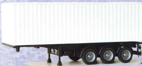
Best.-Nr. 500 189** Solo-Auflieger 30ft. Container DM 9.90