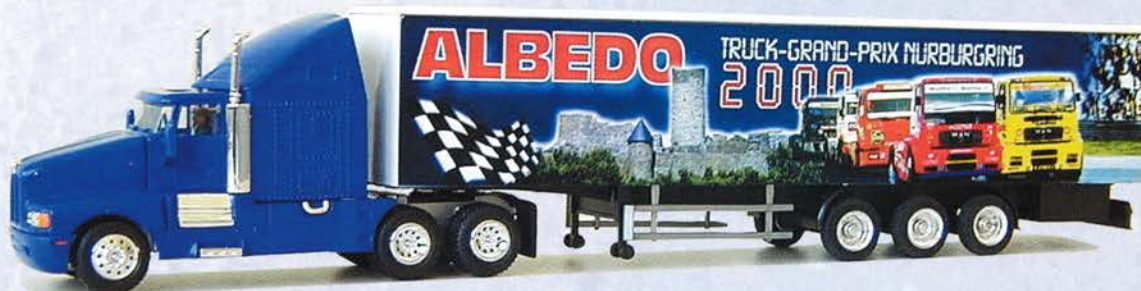
Best.-Nr. 200 103* Kenworth Koffersattelzug "Truck Grand Prix 2000" DM 39.-