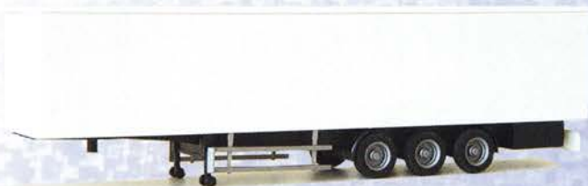
Best.-Nr. 500 183** Solo-Auflieger Kofferaufbau DM 10.90