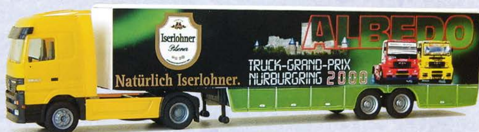
Best.-Nr. 250 105* MB Actros 2achs Koffersattelzug "Iserlohner" DM 43.-