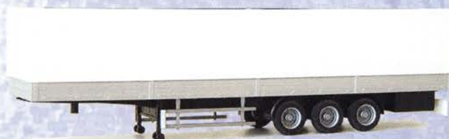
Best.-Nr. 500 185** Solo-Auflieger Planensattel DM 10.90