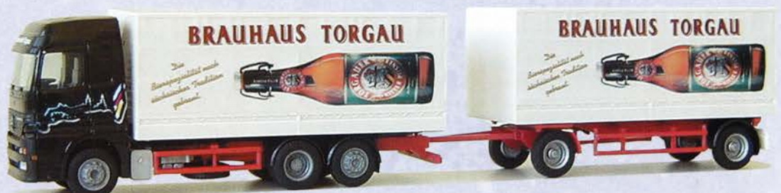
Best.-Nr. 250 091* MB Actros Hängerzug "Torgauer Bier" DM 38.-