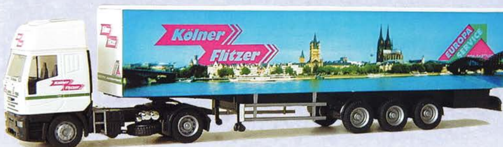
Best.-Nr. 200 102* Iveco Eurostar "Kölner Flitzer" DM 39.-