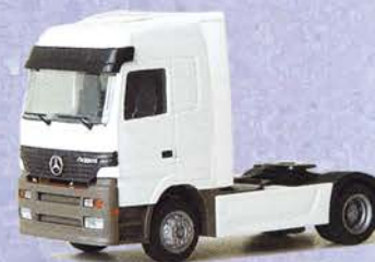
Best.-Nr. 500 193** MB-Actros Solo-Zugmaschine DM 14.90