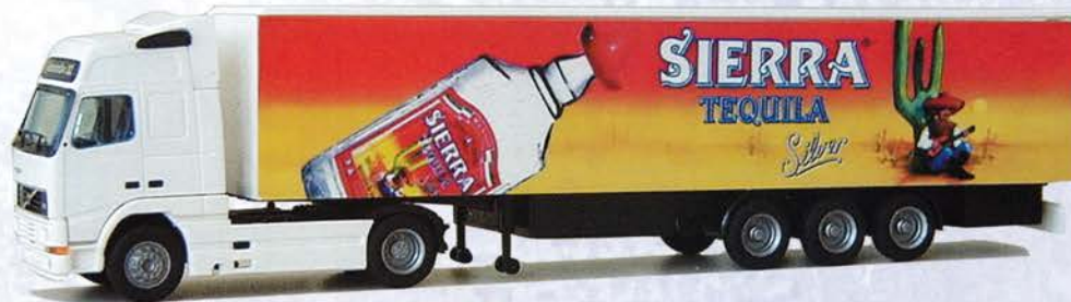
Best.-Nr. 320 084* Volvo XL Sattelzug "Sierra Tequila"