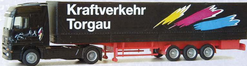
Best.-Nr. 250 088* MB Actros Planensattel "Kraftverkehr Torgau" DM 35.-