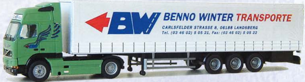
Best.-Nr. 320 083* Volvo XL Gardinenplane "Winter-Transporte" DM 36.-