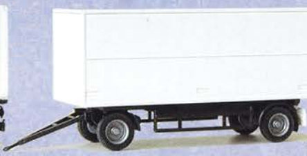
Best.-Nr. 500 190** Solo-Anhänger Getränkekofer DM 8.90