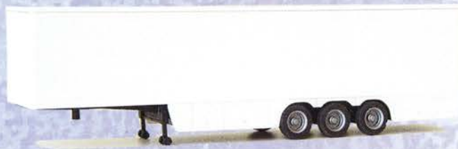
Best.-Nr. 500 184*** Solo-Auflieger Koffer m. Verkl. DM 10.90