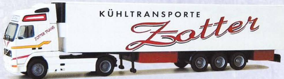
Best.-Nr. 320 082* Volvo XL Kühlkoffer "Zotter-Spedition" DM 34.-