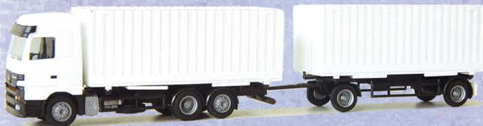
Best.-Nr. 500 192*** MB Actros Hängerzug Tulo-Box Aufbau DM 21.90