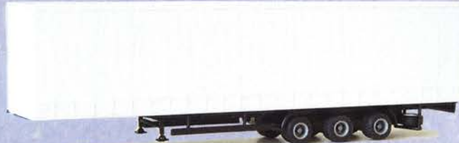
Best.-Nr. 500 188*** Solo-Auflieger Megatrailer Plane DM 10.90