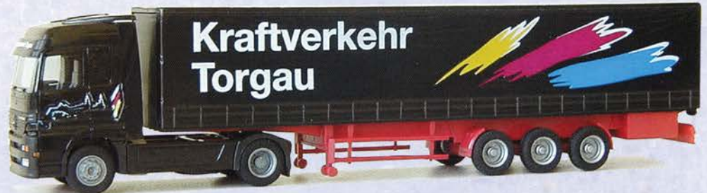
Best.-Nr. 250 089* MB Actros Gardinenplane "Kraftverkehr Torgau" DM 35.-