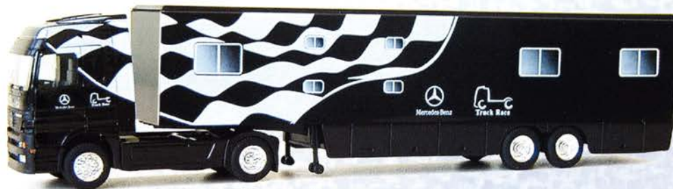
Best.-Nr. 250 101* MB Actros Renntransporter "MB Larag schwarz" DM 36.-