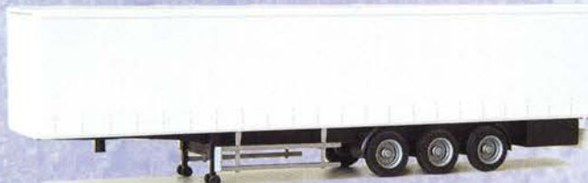
Best.-Nr. 500 186*** Solo-Auflieger Gardinenplane DM 10.90