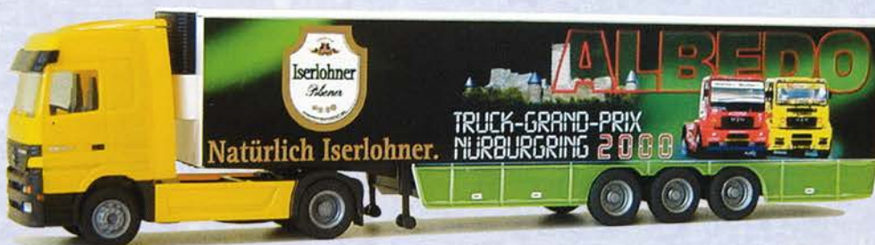
Best.-Nr. 250 106* MB Actros 3achs Koffersattelzug "Iserlohner" DM 43.-